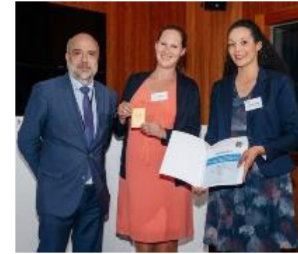
Sexualbildung im Kontext Geflüchtete