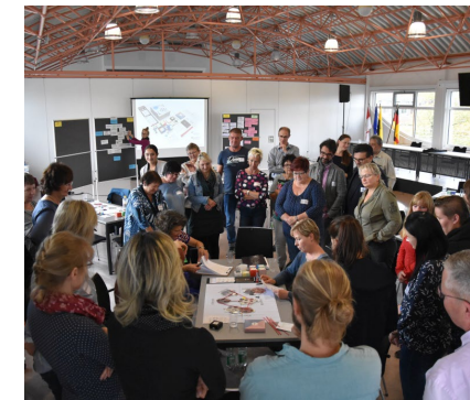
Partizipationsprozess Bildungscampus Nmbg